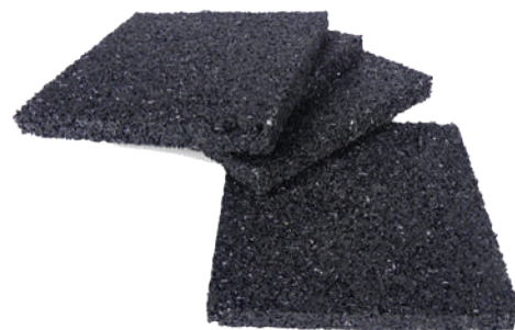
Podkładki pod legary

Legary tarasowe które leżą i stykają się bezpośrednio są narażone na gnicie. W wyniku stałego wilgotnego styku drewna z podłożem powstają uszkodzenia uniemożliwiające bezpieczne użytkowanie tarasu. Zastosowanie podkładek z granulatu gumowego pod legary tarasowe pozwala przedłużyć żywotność legarów tarasowych. Dodatkowo podkładki gumowe posiadają właściwości wygłuszające przez co taras będzie cichy w użytkowaniu i nie będzie przenosił dźwięków.